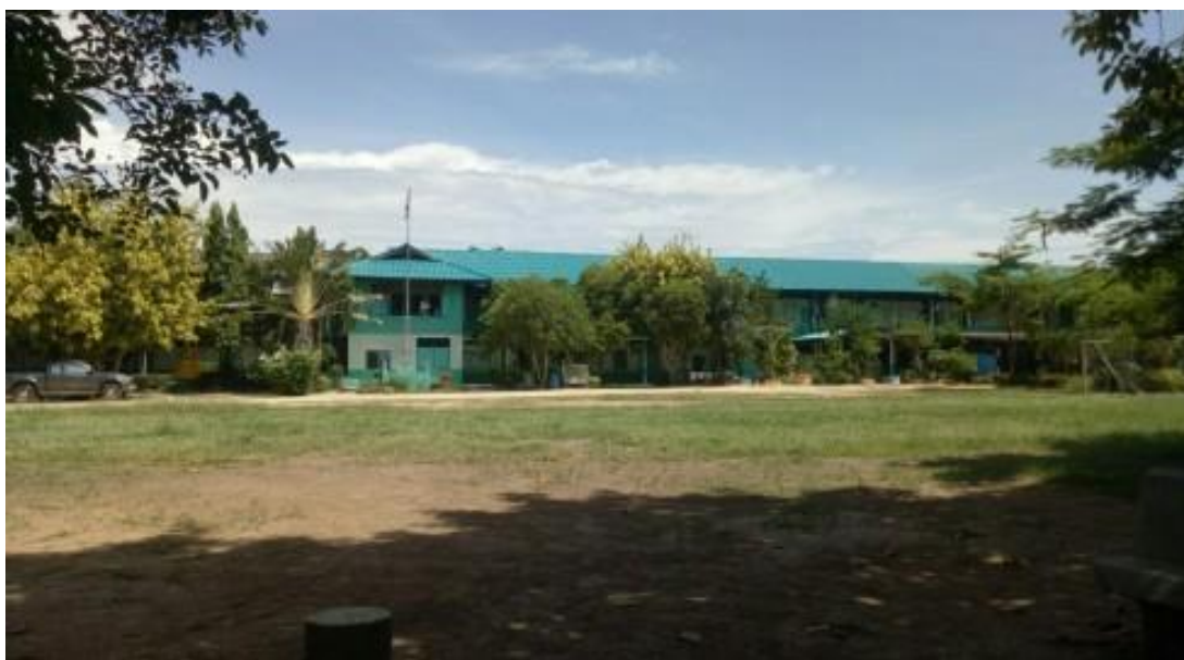
ภาพบริเวณรอบๆ โรงเรียน