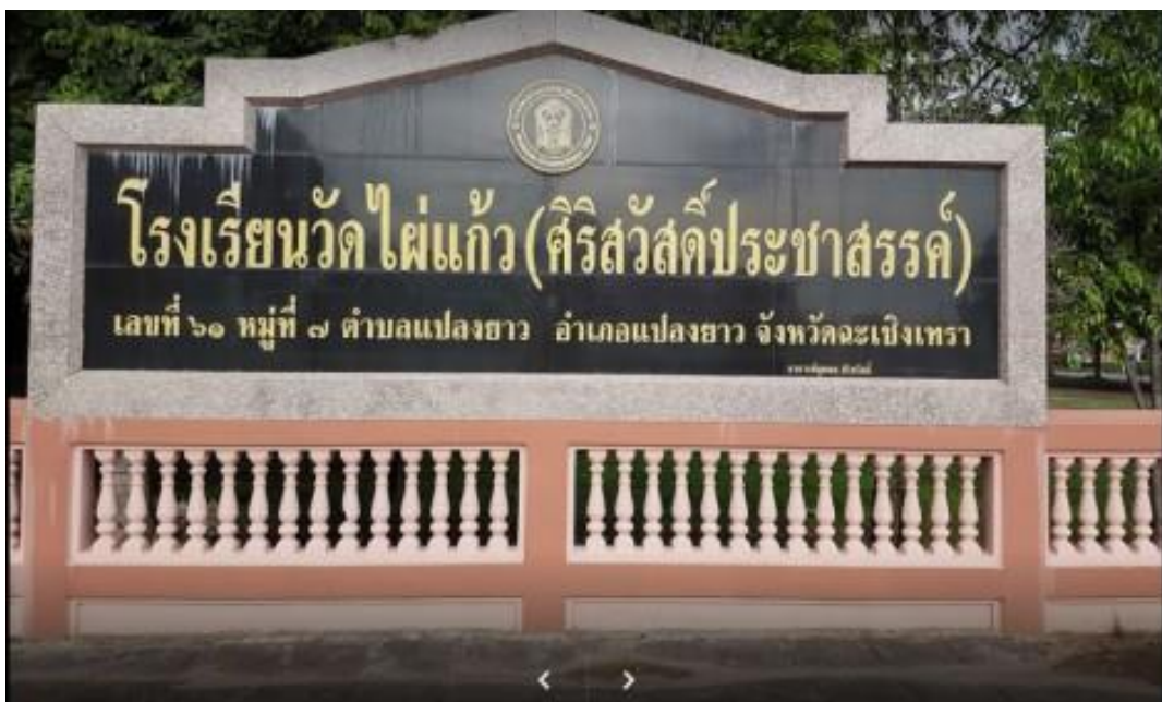
ป้ายหน้าโรงเรียน