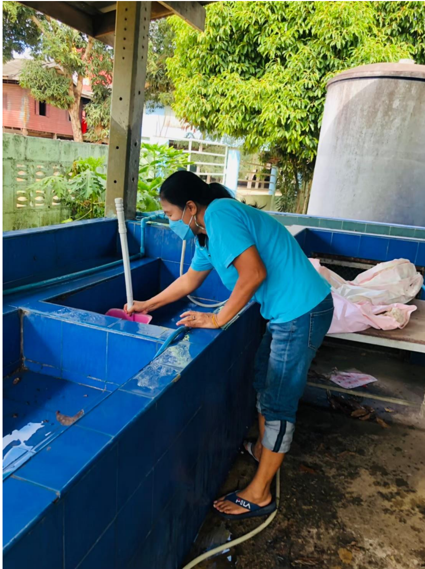
ภาพการเตรียมความพร้อมก่อนเปิดภาคเรียน