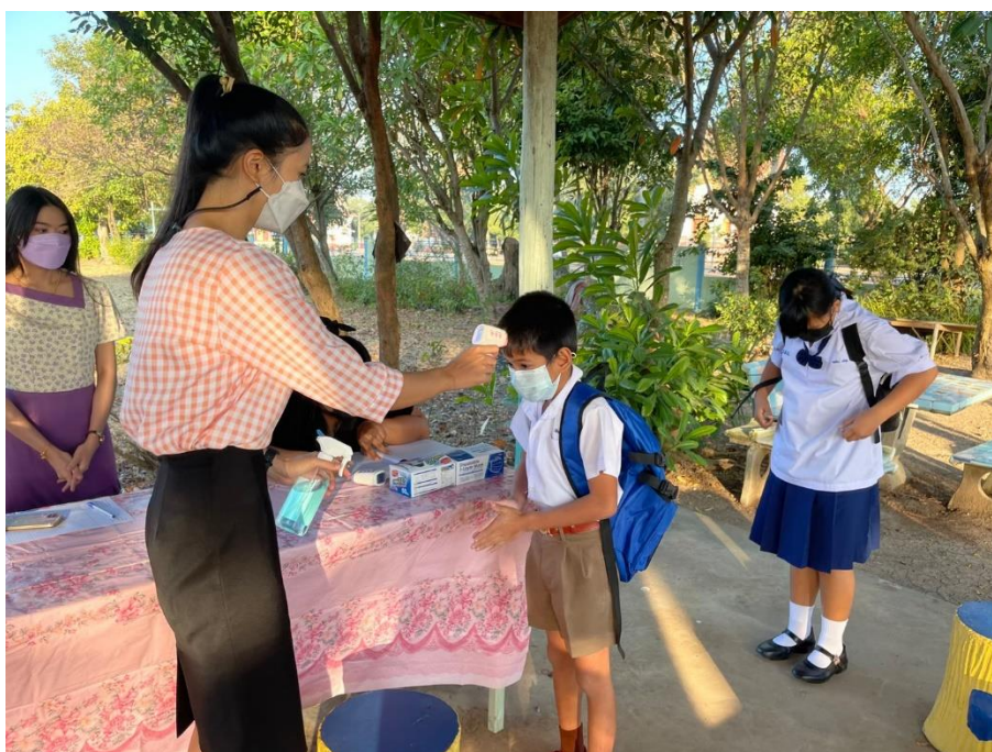
ตรวจวัดอุณหภูมิครูและบุคลากรโรงเรียน ก่อนเข้าโรงเรียนทุกวัน