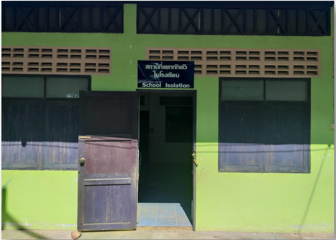
สถานที่แยกกักตัวในโรงเรียน