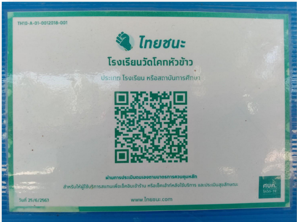
สแกนไทยชนะ / จุดคัดกรอง