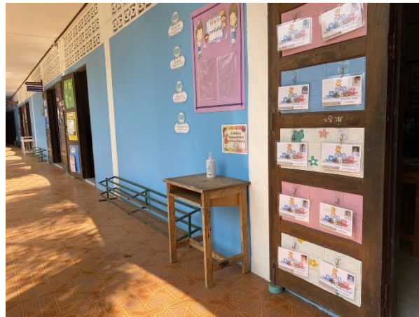
จุดล้างมือ