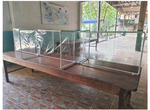
โต๊ะสำหรับนักเรียนรับประทานอาหารกลางวัน