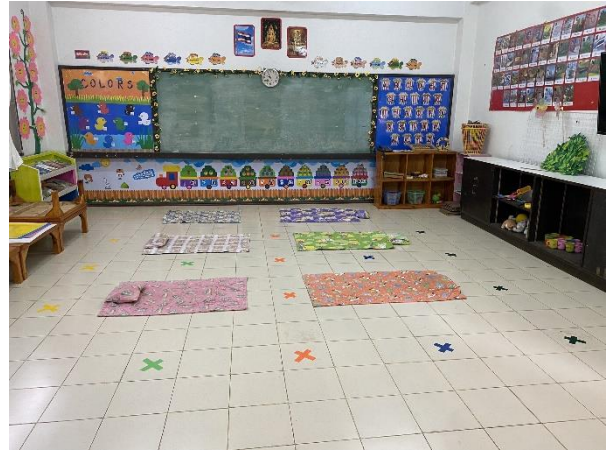
ห้องเรียนต่าง ๆ