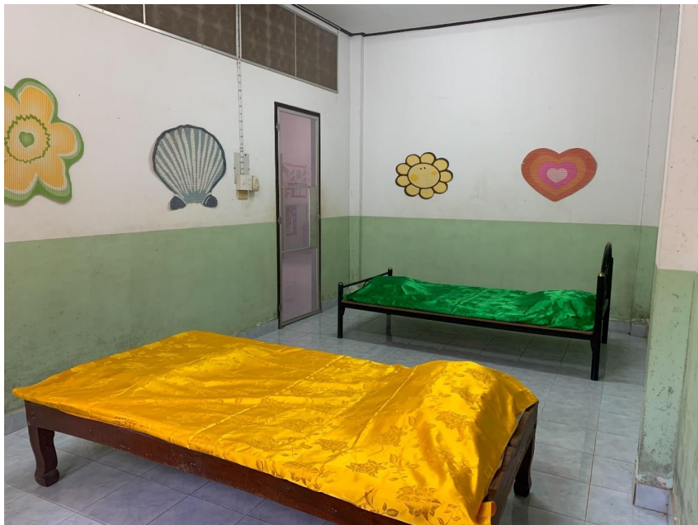
สถานที่แยกกักตัวในโรงเรียน