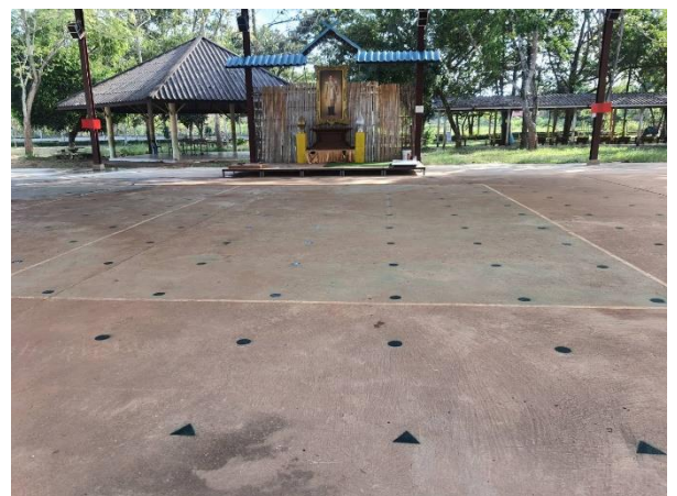
จุดยืนสำหรับนักเรียนเข้าแถวเคารพธงชาติ