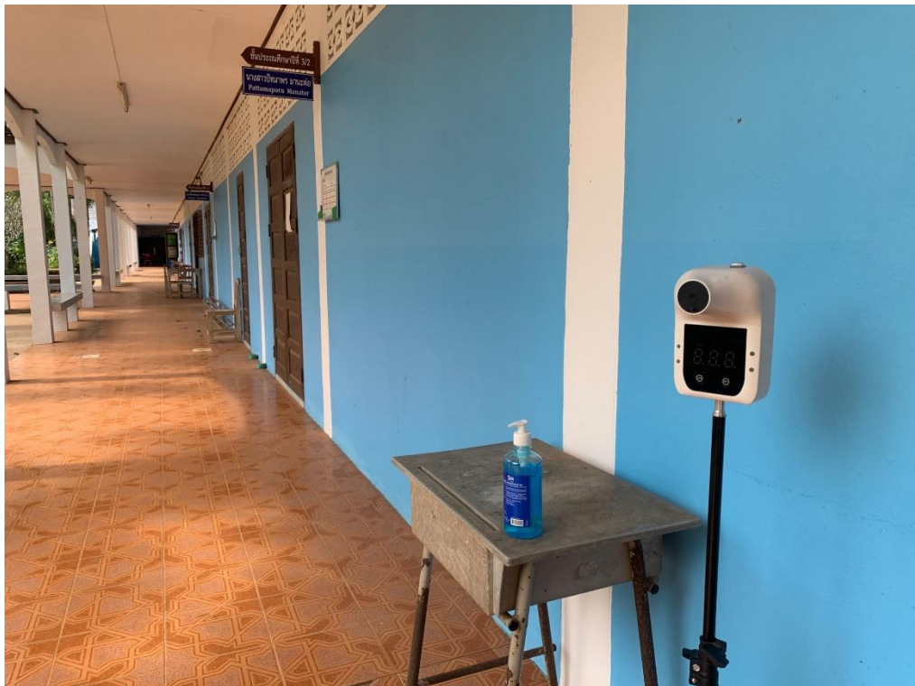
จุดคัดกรองการมาติดต่อกับโรงเรียน