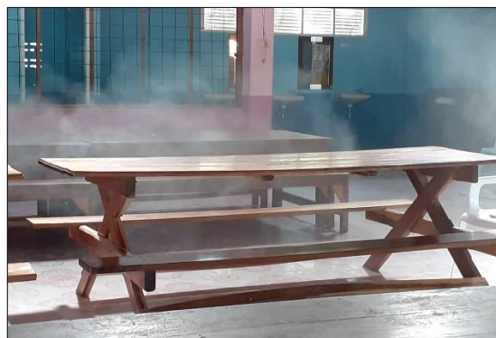
เจ้าหน้าที่เข้าทำการพ่นยาฆ่าเชื้อทุกจุดในโรงเรียน