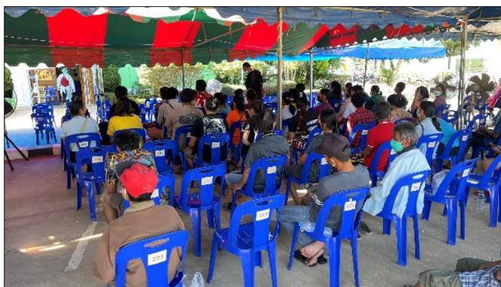
ผู้ปกครองนักเรียนโรงเรียนบ้านศรีเจริญทอง เข้ารับวัคซีนป้องกันเชื้อไวรัสโคโรนา ๒๐๑๙