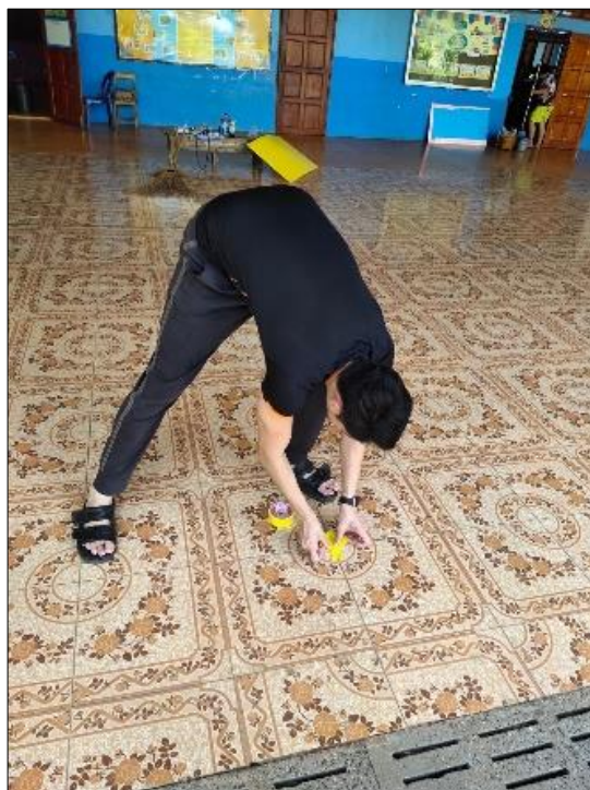
กำหนดจุดในการเว้นระยะห่าง ๑ - ๒ เมตร