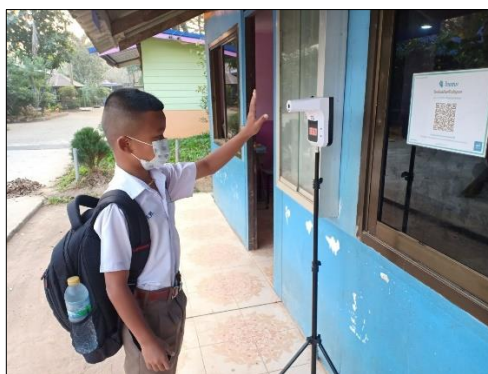
กำหนดให้มีจุดคัดกรองทุกทางเข้า-ออกของโรงเรียน