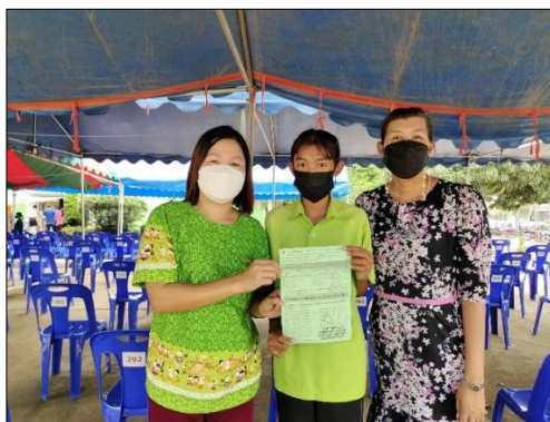
นักเรียนอายุ ๑๒-๑๘ ปี โรงเรียนบ้านศรีเจริญทอง เข้ารับวัคซีนป้องกันเชื้อไวรัสโคโรนา ๒๐๑๙