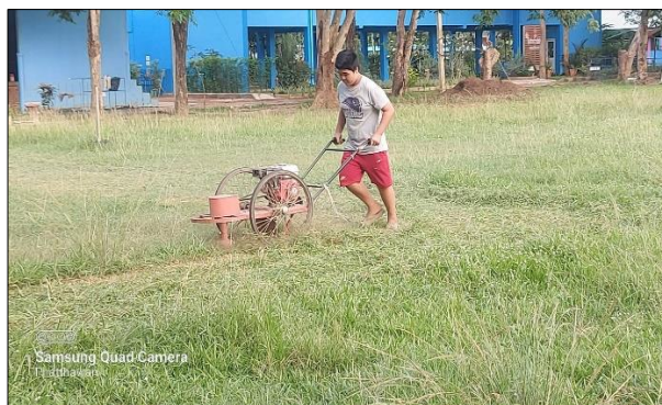
ทำความสะอาดบริเวณต่างๆในโรงเรียนเพื่อเตรียมการเปิดเรียน