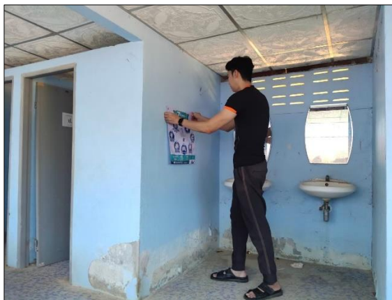
การจัดทำและติดตั้งป้ายมาตรการต่างๆเกี่ยวกับการป้องกันการติดเชื้อไวรัสโคโรนา ๒๐๑๙