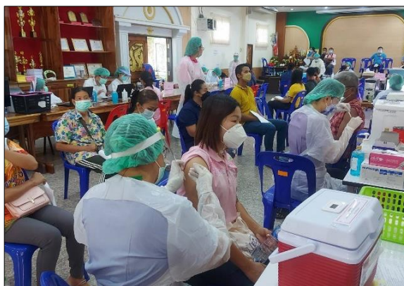
ครูและบุคลากรทางการศึกษา โรงเรียนบ้านศรีเจริญทอง เข้ารับวัคซีนป้องกันเชื้อไวรัสโคโรนา ๒๐๑๙