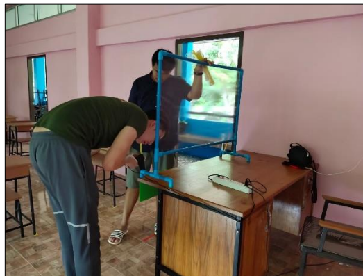
จัดทำฉากกั้นระหว่างโต๊ะครูเพื่อลดความเสี่ยงขณะเรียนในห้องเรียน