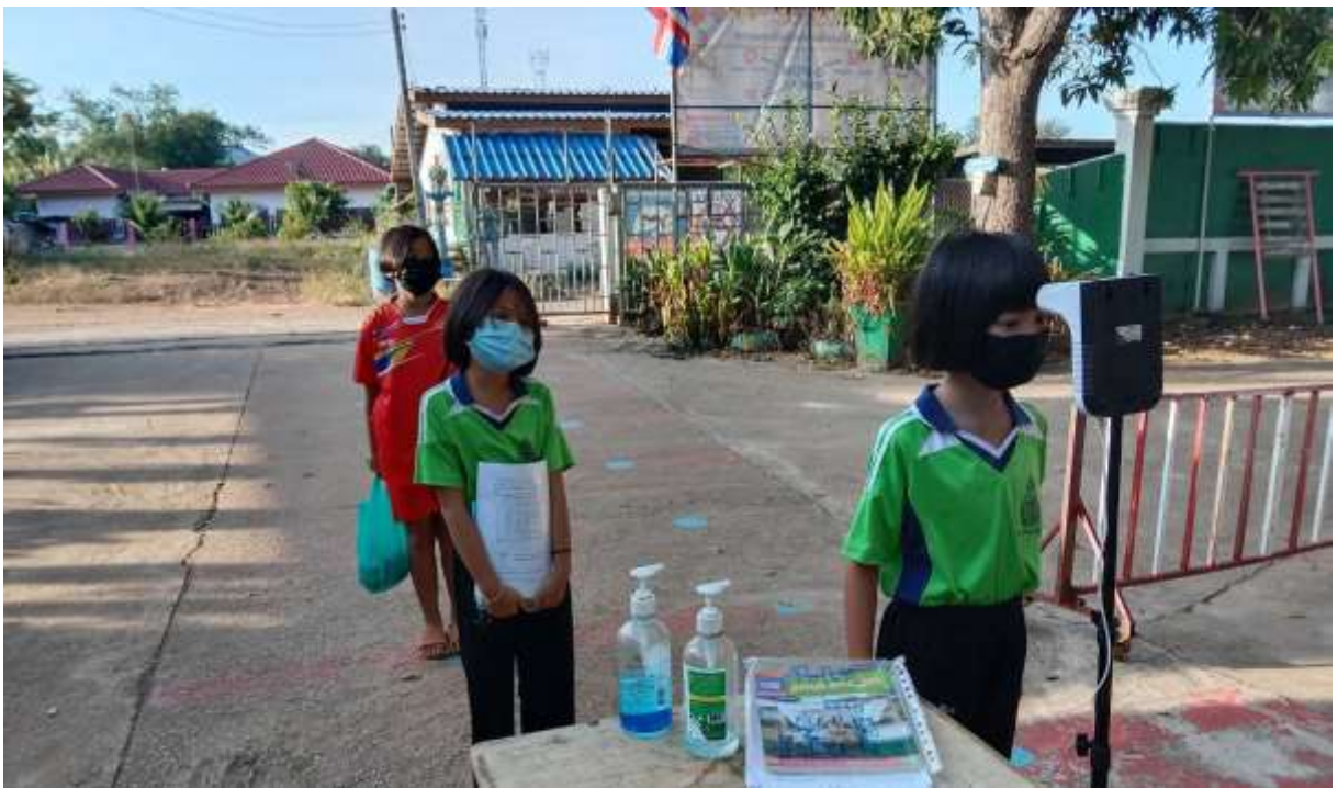
ให้นักเรียนและผู้มาติดต่อทุกคนตรวจวัดอุณหภูมิก่อนเข้าสถานศึกษา