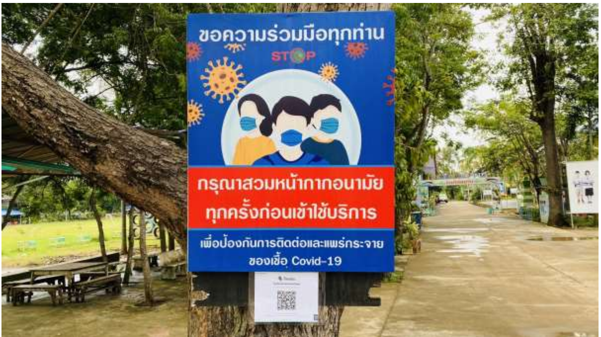
การให้บุคคลภายนอกที่เข้ามาติดต่อโรงเรียนสวมหน้ากากอนามัยตลอดเวลา