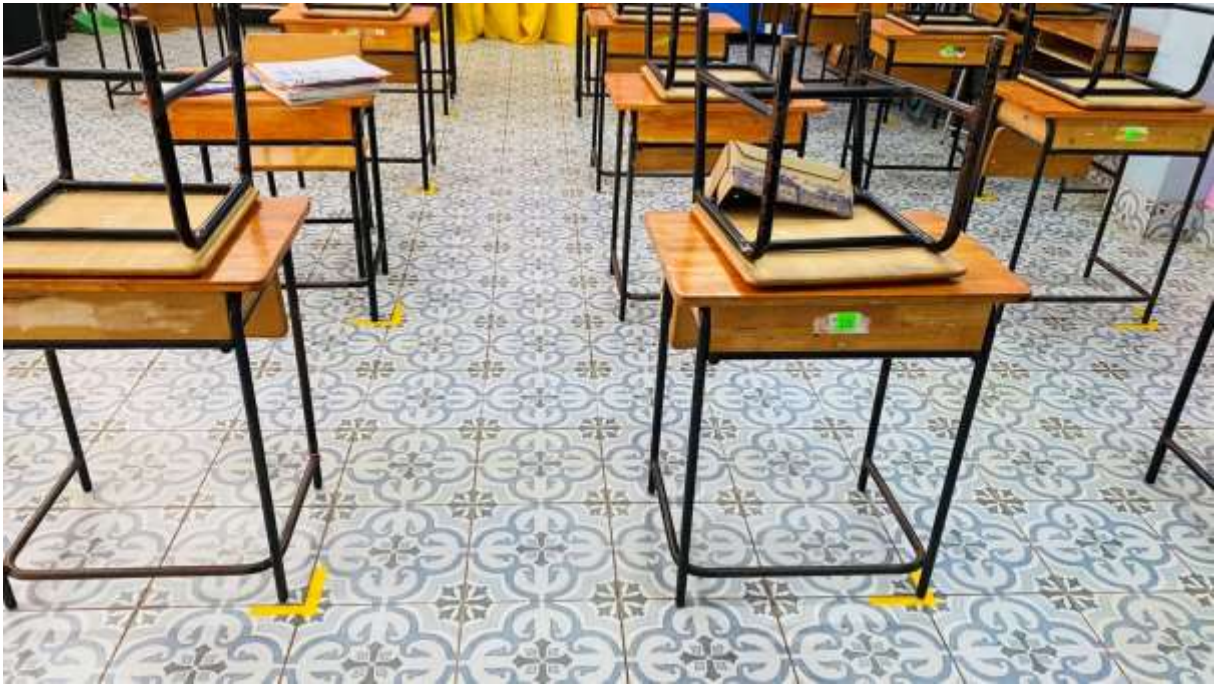
การเว้นระยะห่างในห้องเรียน การจัดโต๊ะเรียนให้ห่างกันอย่างน้อย ๑ เมตร