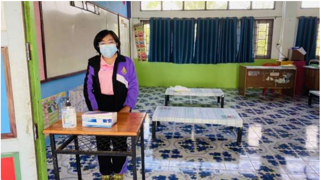
มีจุดบริการเจลแอลกอฮอล์และหน้ากากอนามัยให้กับนักเรียน ครู และผู้มาติดต่อก่อนเข้ารับบริการ