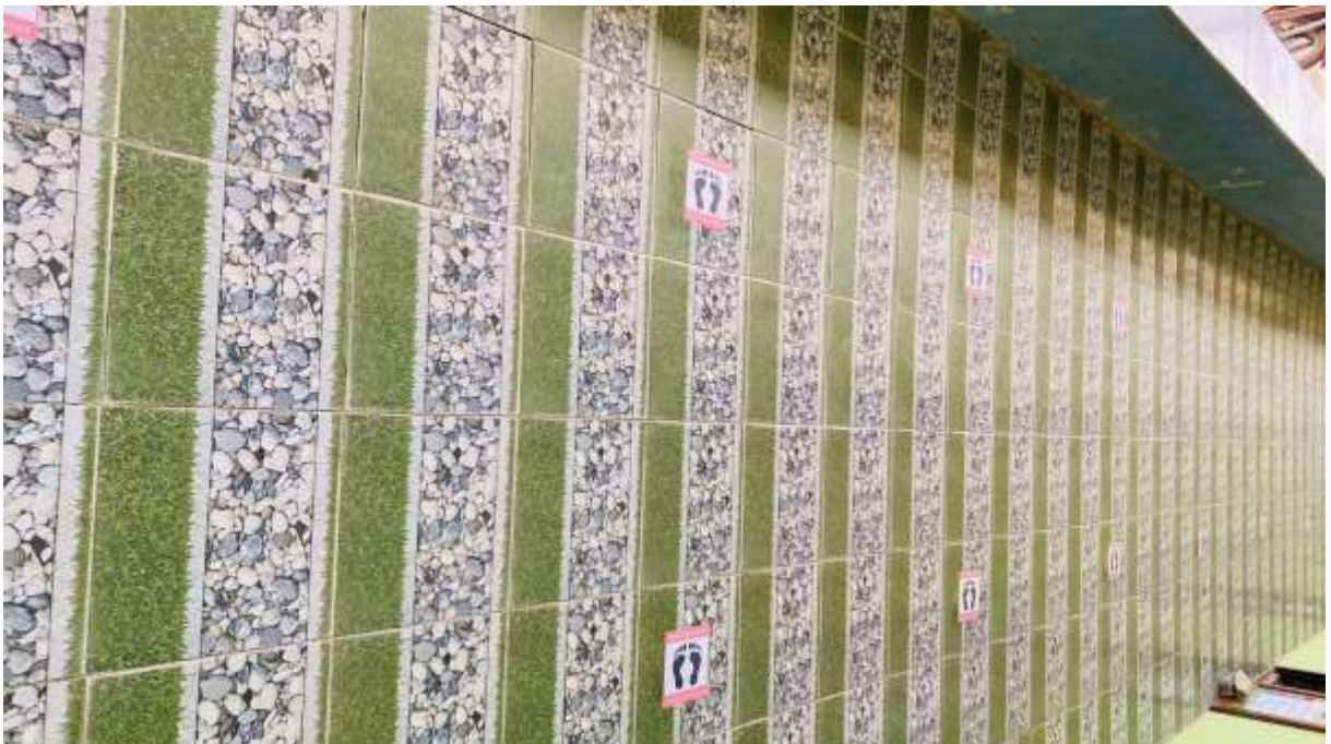
การกำหนดจุดเข้าแถวทำกิจกรรมแบบเว้นระยะห่างบุคคลอย่างน้อย ๑ เมตร