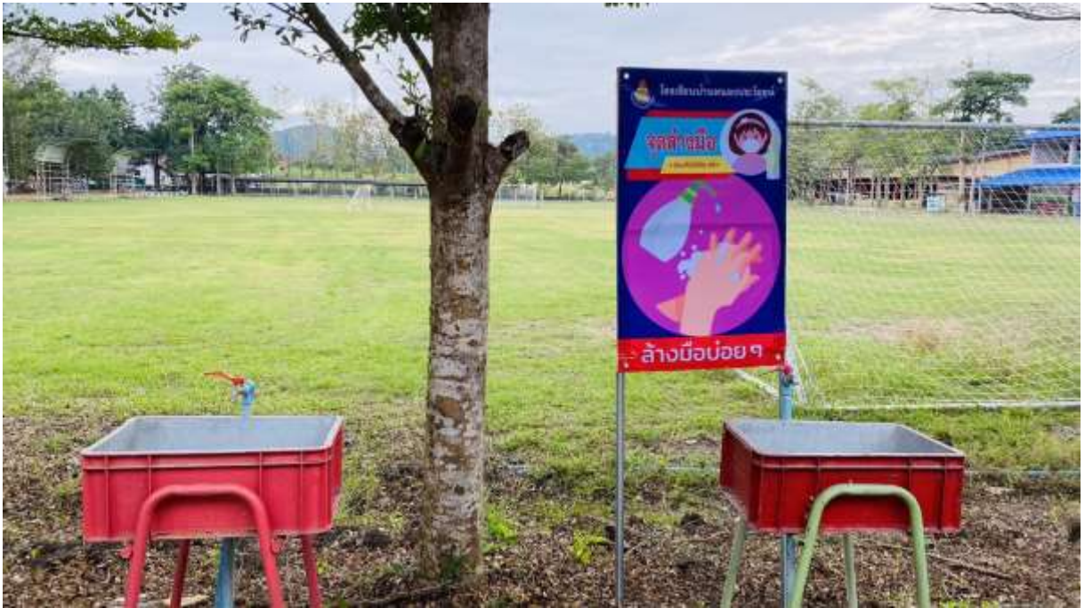
มีจุดล้างมือให้กับนักเรียนและวิธีการล้างมือที่ถูกต้อง