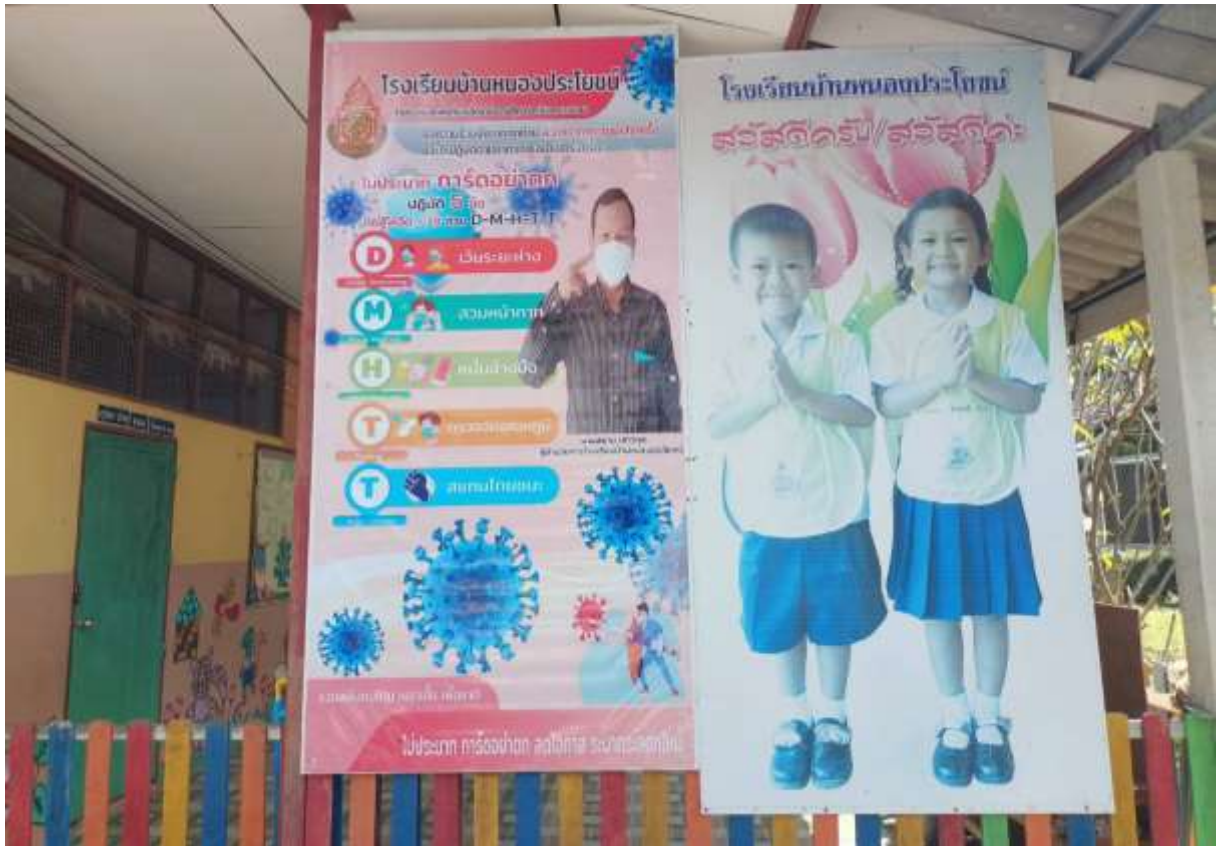
โรงเรียนมีการดำเนินการติดป้ายประชาสัมพันธ์เรื่องการดูแลตนเองให้นักเรียน และมีนโยบายให้ครูคอยดูแล กำกับนักเรียนอย่างเคร่งครัด