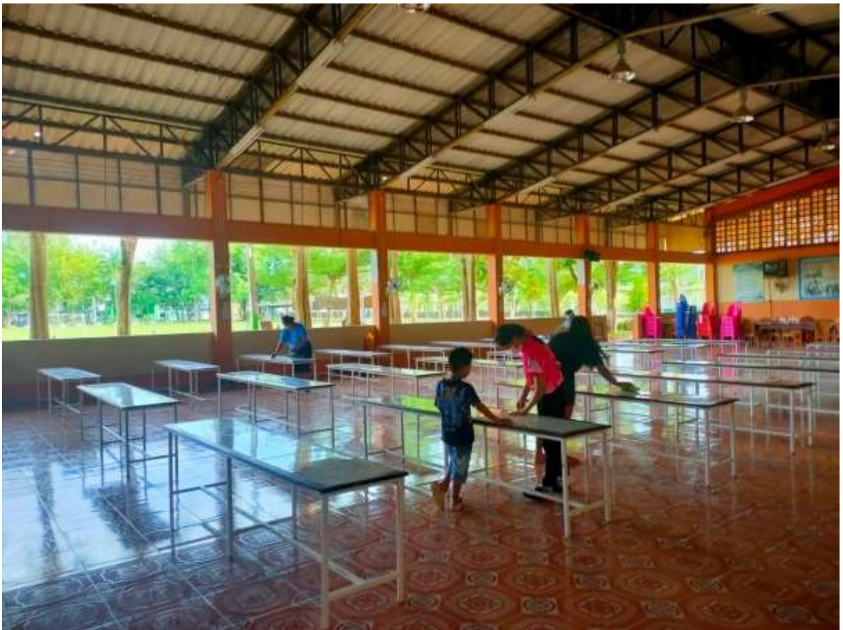
ความสะอาด บริเวณพื้นผิวสัมผัสร่วม อาทิ ที่จับประตู ลูกบิดประตู ราวบันได เป็นต้น