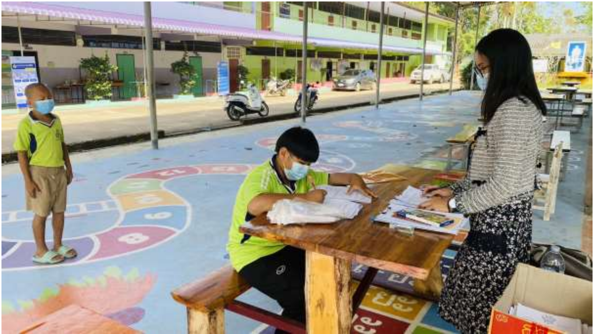
ให้นักเรียนและครูสวมหน้ากากอนามัยตลอดเวลา