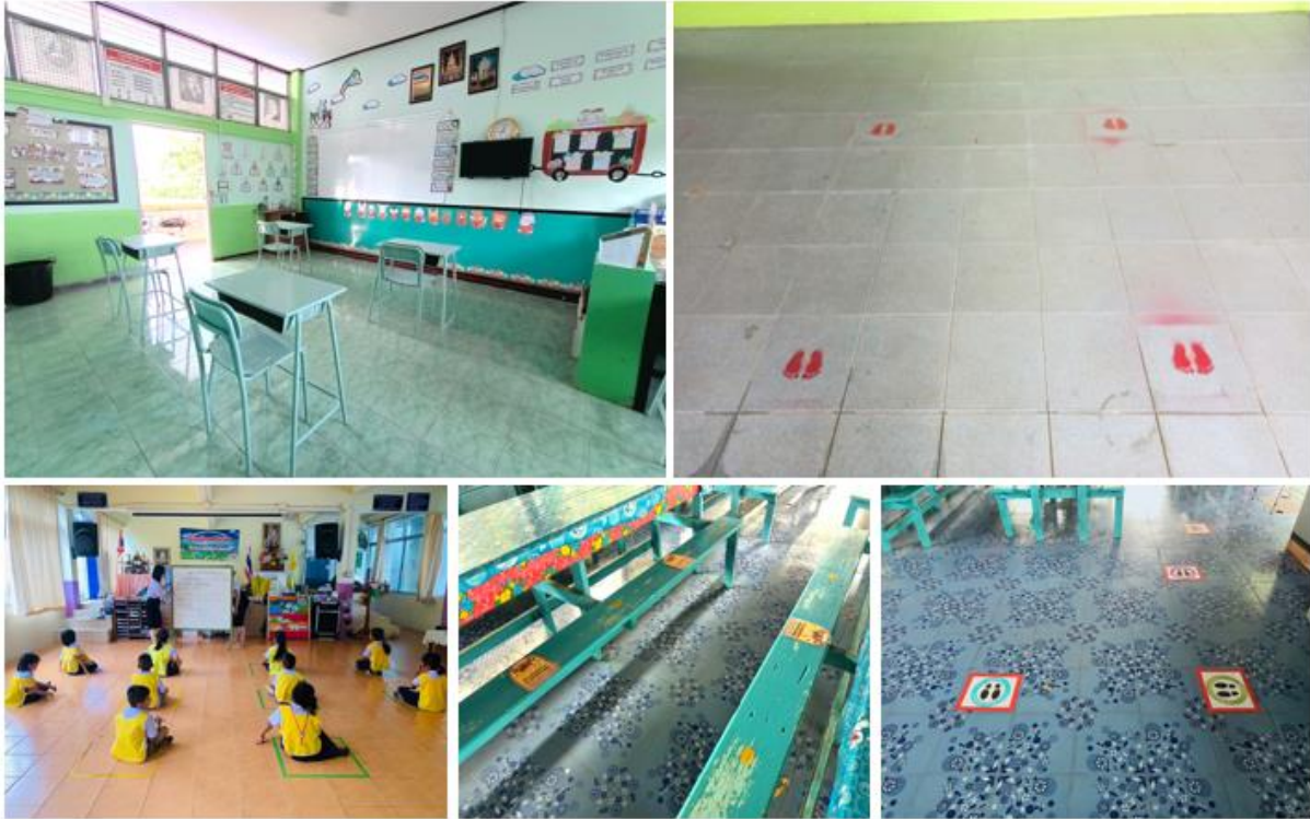
ภาพประกอบการแออัด ลดการรวมกลุ่ม ไม่เข้าไปในพื้นที่ที่มีคนจำนวนมาก