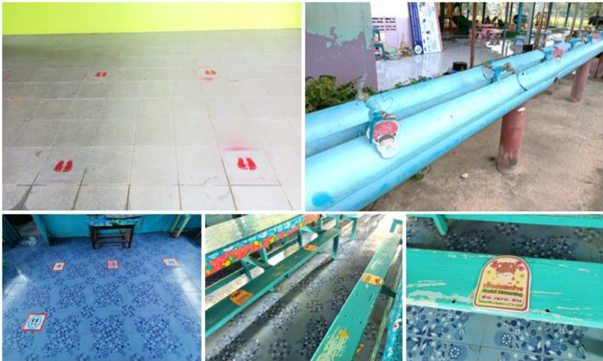
ภาพประกอบการทำเครื่องหมายการเว้นระยะห่าง

การปฏิบัติ ทำเครื่องหมายเว้นระยะห่างว่างทางเดิน ระเบียบ ระยะห่างระหว่างบุคคล อย่างน้อย 1 - 2 เมตร และจัดทำสัญลักษณ์แสดงจุดตำแหน่งชัดเจน