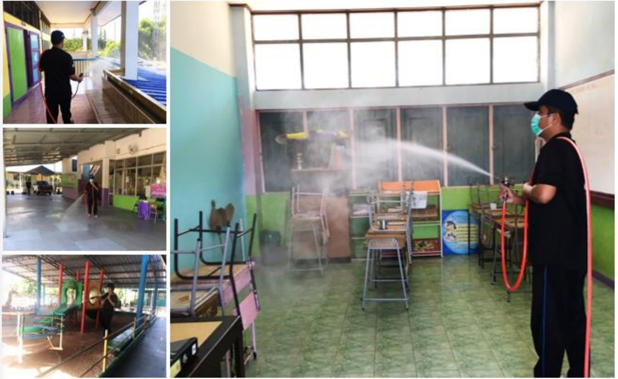
ภาพประกอบการพ่นน้ำยาฆ่าเชื้อในห้องเรียน