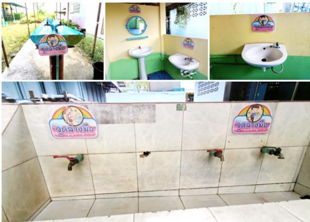
ภาพประกอบความการเตรียมสถานที่ในการล้างมือ