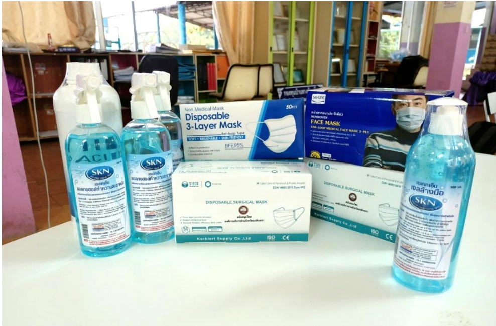
ภาพประกอบการเตรียมหน้ากากอนามัยสำรองให้เพียงพอ