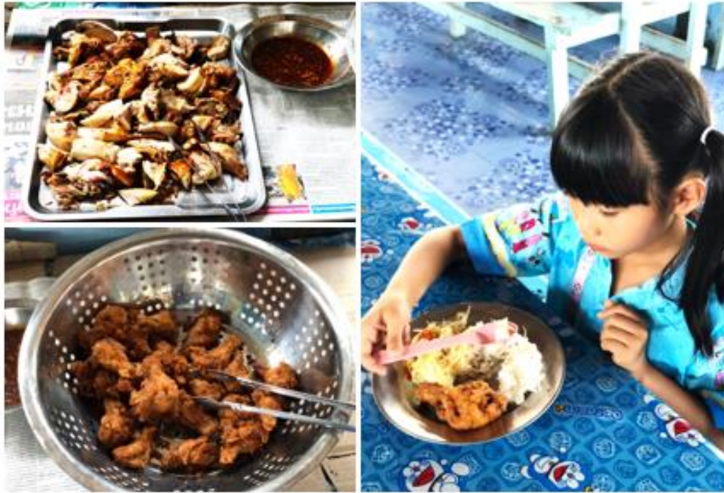
มีอาหารปรุงสุกใหม่ และใช้ช้อนส่วนตัว

เช่น การจัดซื้อจัดหาวัตถุดิบจากแหล่งอาหาร การปรุงประกอบอาหารตามมาตรฐานสุขาภิบาลอาหารในโรงเรียน