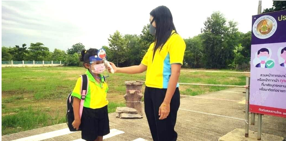
ภาพประกอบการตรวจวัดอุณหภูมิ

การปฏิบัติ มีการเตรียมเครื่องวัดอุณหภูมิไว้ประจำที่จุดคัดกรอง และวัดอุณหภูมินักเรียนทุกครั้ง ก่อนขึ้นอาคารเรียน ติดสติ๊กเกอร์แก่นักเรียนที่วัดอุณหภูมิแล้ว