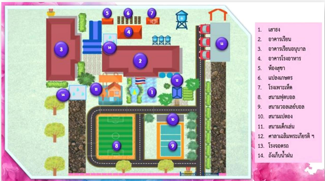
รูปภาพที่ 1 แสดงอาคารและบริเวณของโรงเรียนวัดทางข้ามน้อย (ศรีวิไลประชาสรรค์)