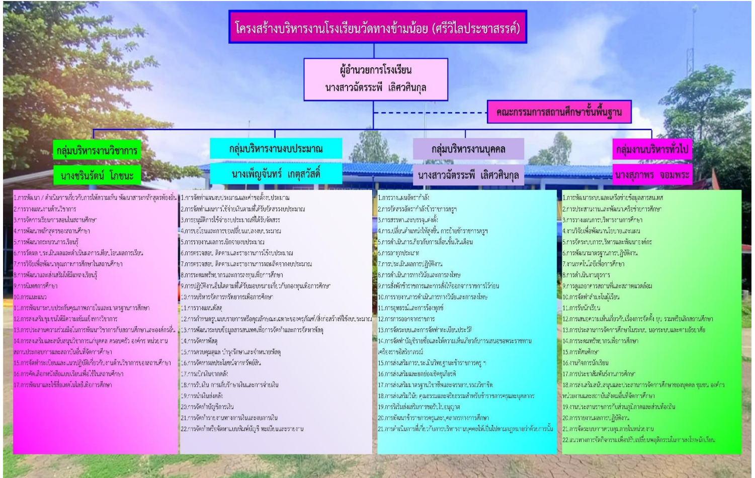
รูปภาพที่ 2 ผังโครงสร้างการบริหารงานโรงเรียนวัดทางข้ามน้อย (ศรีวิไลประชาสรรค์)