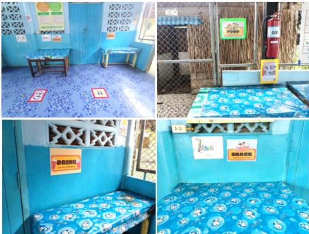
มีจุดพื้นที่ให้บริการในการรับอาหาร