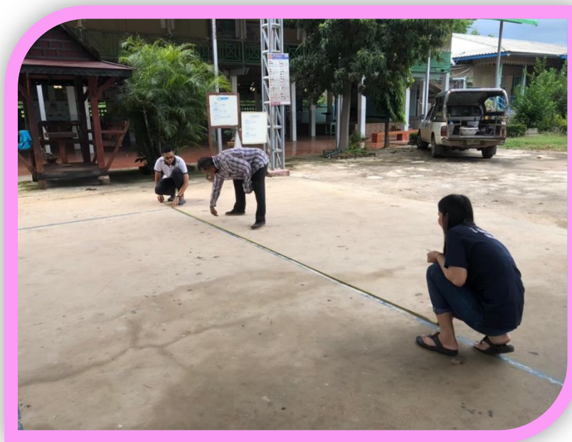
จัดทำจุดเว้นระยะห่างตามมาตรการ