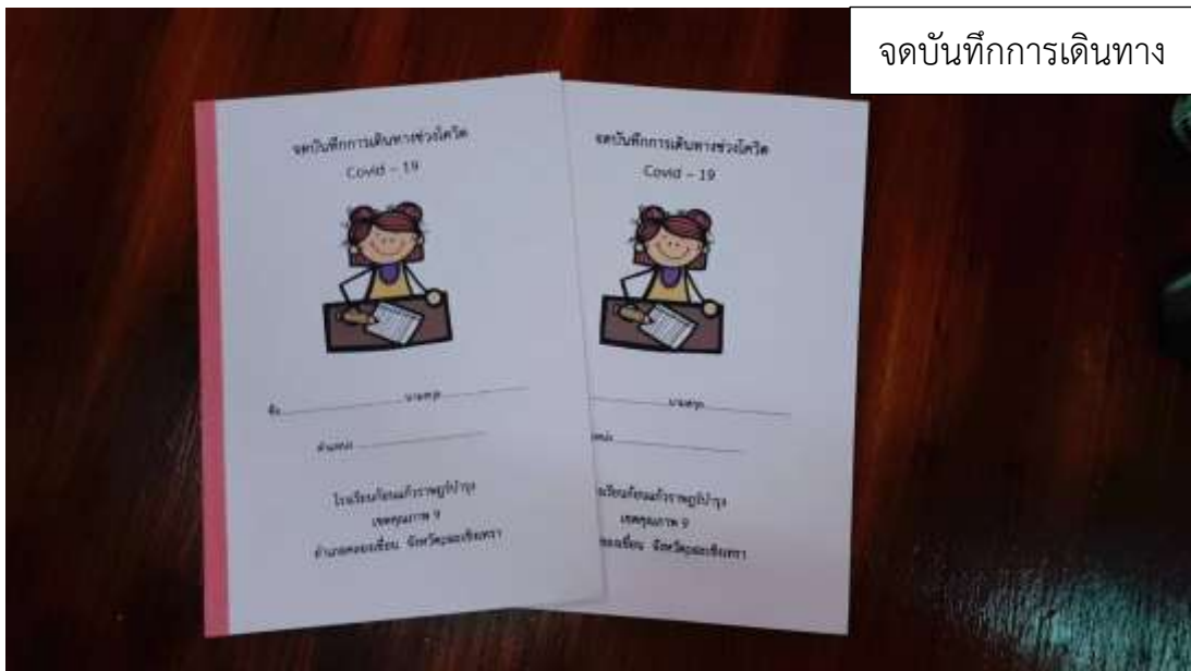
จดบันทึกการเดินทาง