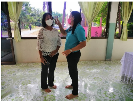
จัดเตรียมหน้ากากอนามัย แอลกอฮอล์ล้างมือ และการคัดกรองวัดไข้เมื่อเข้ามาในโรงเรียน