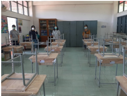
เว้นระยะห่าง ในการทำกิจกรรม